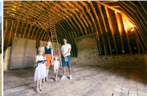
Rénovation de l'escalier principal, du perron et du sol en tomette sous les charpentes du château