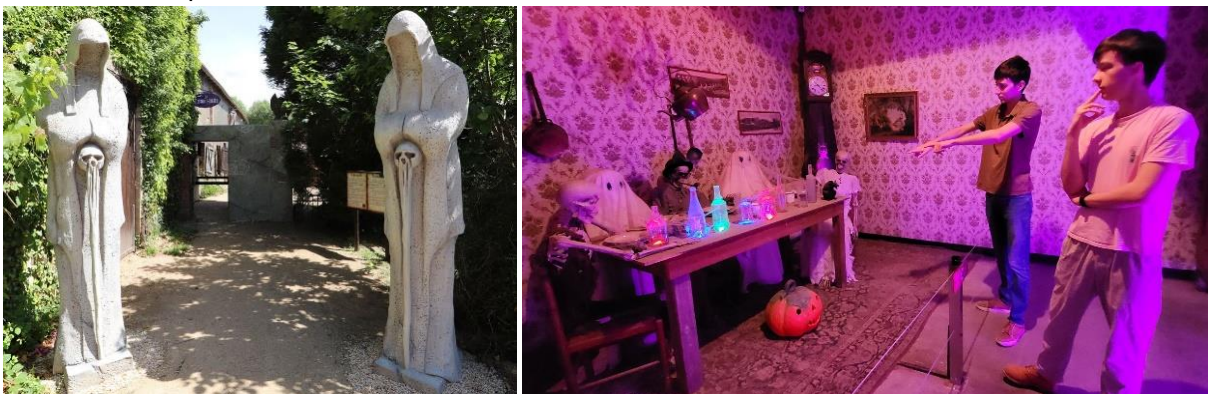
L'entrée de la Maison Hantée à gauche et une des salles d'énigmes de l'escape game à droite

Parmi les autres expériences du parc à découvrir en famille ou entre amis dès le 5 avril, l'escape game de la Maison Hantée , créé en 2019, peut accueillir jusqu'à 350 joueurs par jour. C'est ainsi l'escape game avec la plus grande capacité d'accueil quotidienne en France. Par équipes de 2 joueurs minimum, accessibles dès 10 ans en français comme en anglais, les participants doivent lever la malédiction qui hante l'ancienne maison du jardinier du château. La Maison Hantée peut recevoir jusqu'à 7 personnes toutes les 7 minutes grâce à un système d'automatisation permettant de passer d'une salle d'énigmes à l'autre sans croiser les autres groupes, avec des sas animés entre chaque salle pour une expérience immersive continue. Autre aspect singulier de cet escape game : il n'est pas nécessaire de réserver pour participer. À leur arrivée, les visiteurs se voient attribuer un créneau horaire, garantissant ainsi une disponibilité constante sans besoin de réservation préalable.